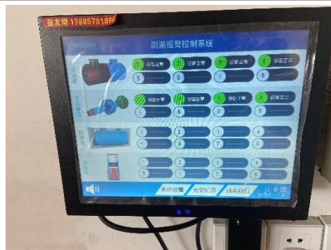
测漏报警控制系统