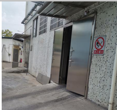
过氧化氢仓库外观图