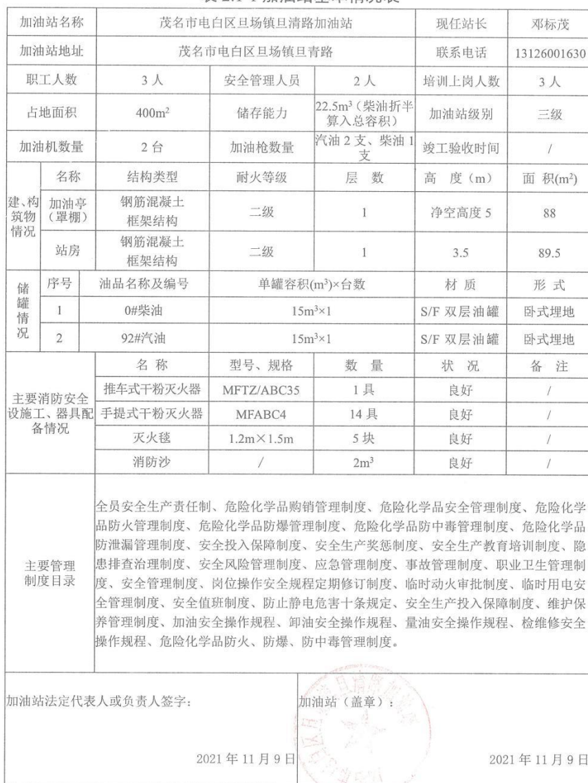
表 2.1-1 加油站基本情况表