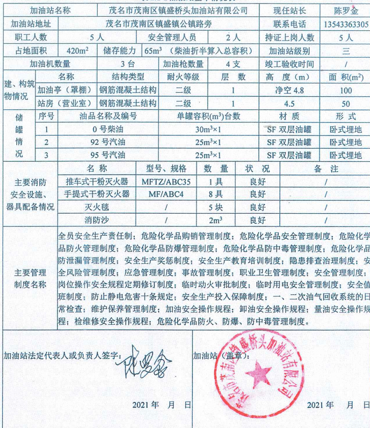
表 2.1-1 加油站基本情况表

品经营单位主要负责人安全资格证书，另设 2 名安全管理人员，均取得危险化学品经营单位安全管理人员资格证书。该加油站针对汽油已设置加油、卸油油气回收系统。茂名市茂南区镇盛桥头加油站有限公司基本情况见表 2.1-1。