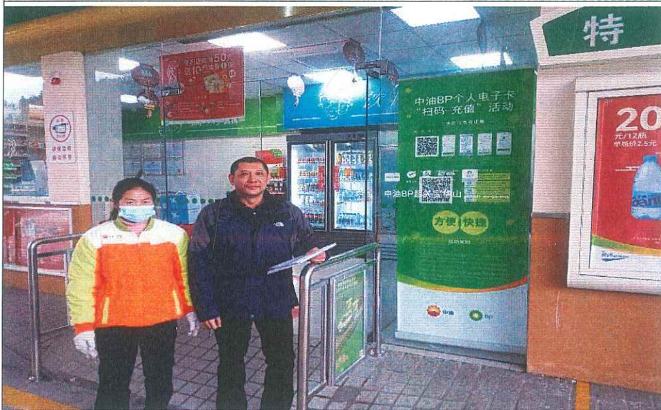
评价组织长现场检查