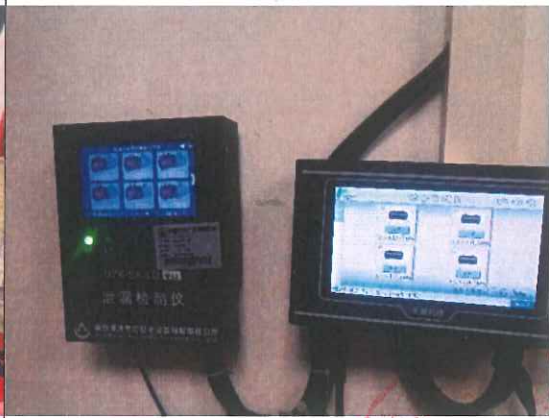
双层罐与双层管渗漏监测显示器