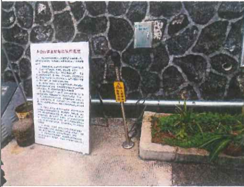
静电接地仪及静电消除器