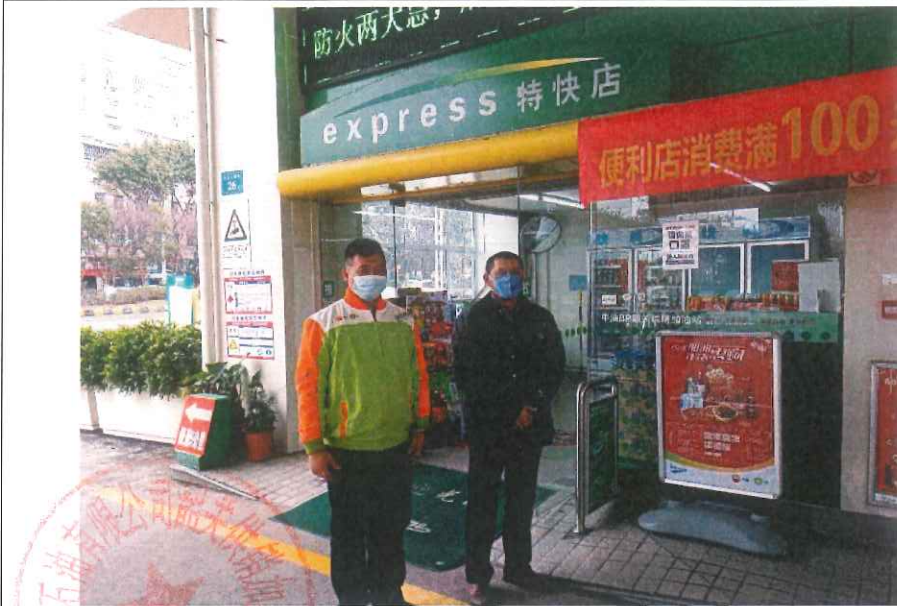
评价组组长现场检查