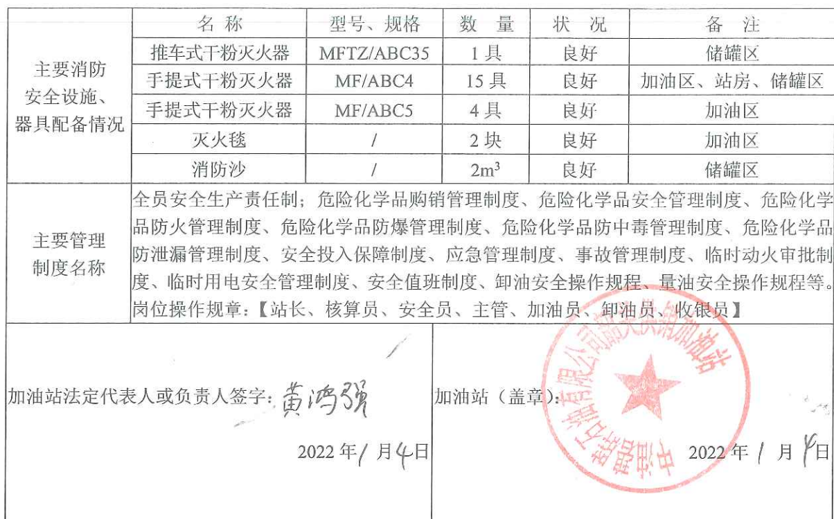
表 2.1-2 加油站自 2019 年 07 月取得经营许可证后至今情况变化一览表