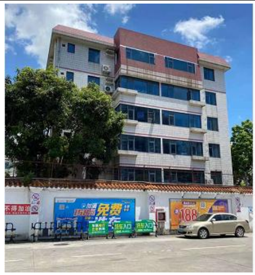
东面倚天苑住宅小区