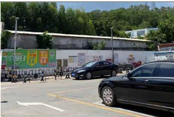
西面市政管理处废弃库房