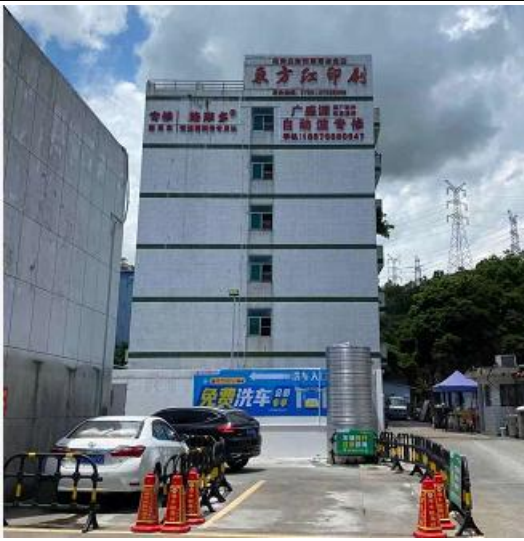
北面东方红印刷厂