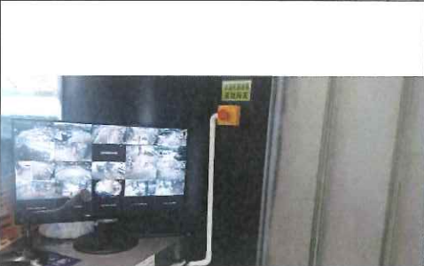
站房内紧急按钮及视频监控