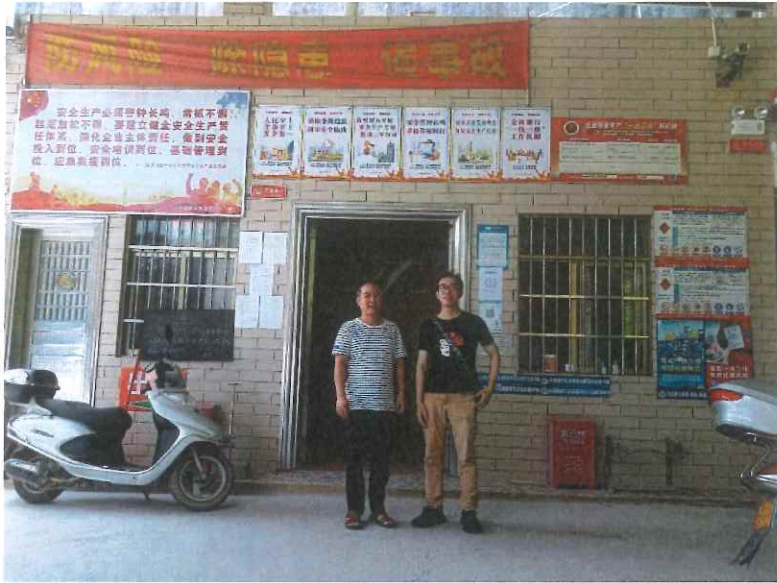
评价公司人员现场检查