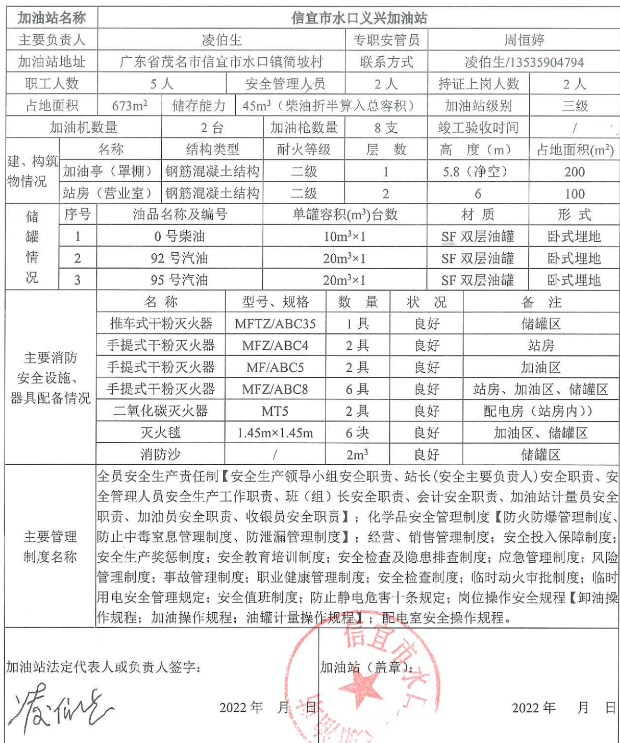
表 2.1-1 加油站基本情况表

为凌伯生，已取得了危险化学品经营单位主要负责人安全资格证书； 另设 1 名专职安全管理人员—周恒婷，已取得危险化学品经营单位安 全管理人员资格证书。该加油站基本情况见表 2.1-1。