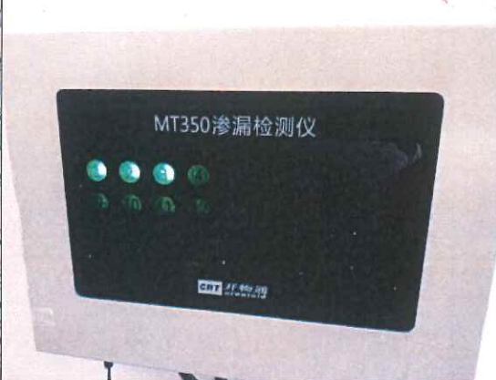
油罐在线渗漏监测仪