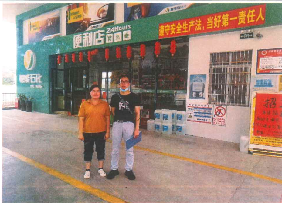
评价公司人员现场检查