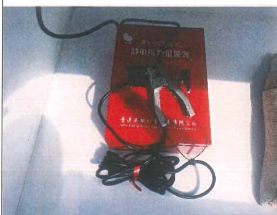
静电接地报警装置