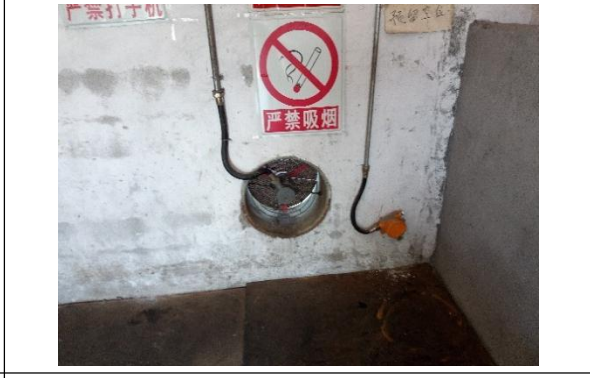
防爆风机与检测探头