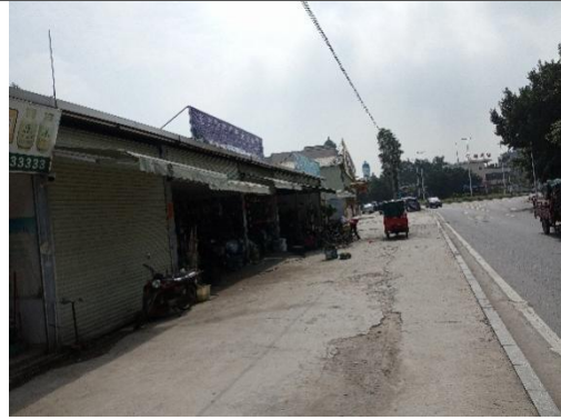
东面空置房间及五金店