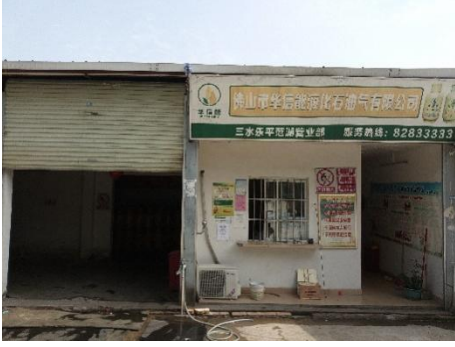
三水乐平范湖营业部外观