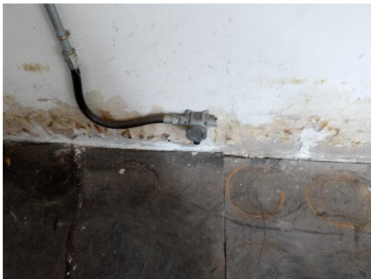
可燃气体检测探头