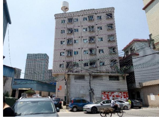
西北配电房及民房