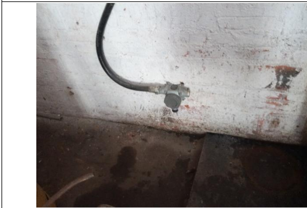
可燃气体检测探头