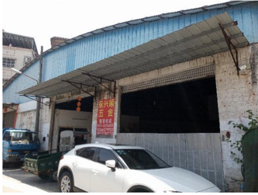
南面永兴顺五金店