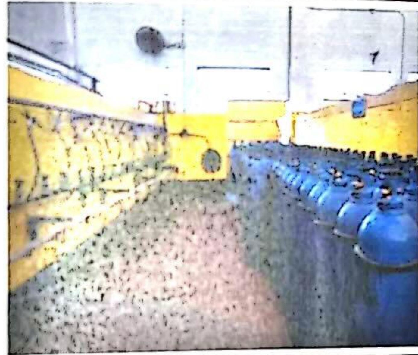
工业气体充装区域