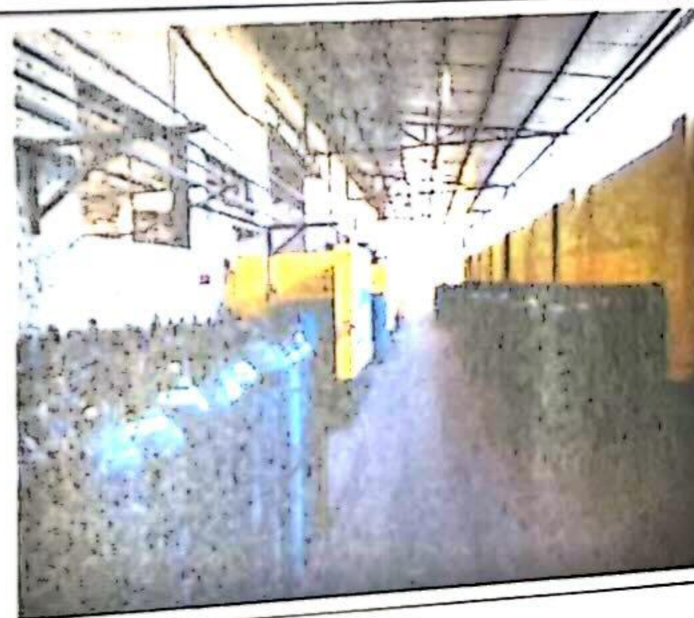
工业气体充装区域