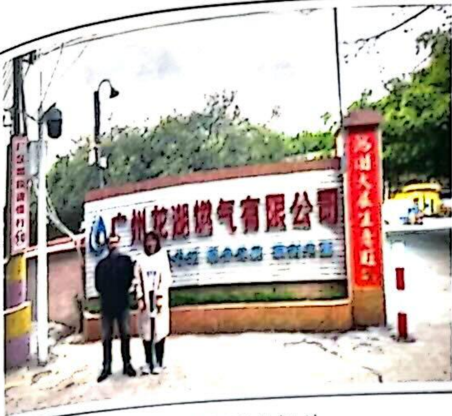
评价师现场调查相片