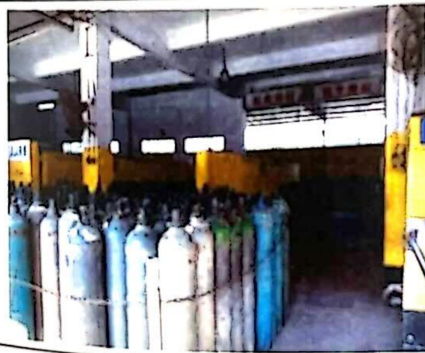
工业气体充装区域