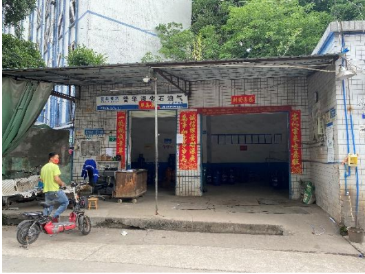
矿泉水经营部外观