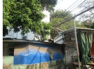
北面单层厂房及六层民房