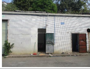
南面营业室、员工休息室和杂物间