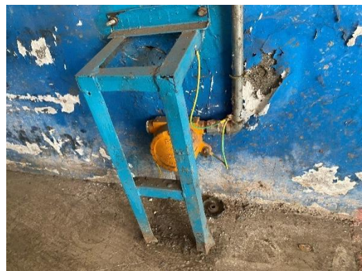
可燃气体检测探头