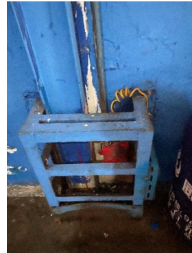
可燃气体检测探头