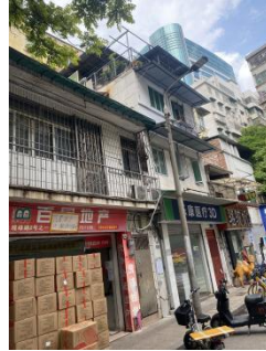
东面百居地产及居民楼