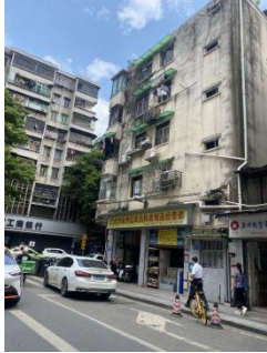
南面观绿路及居民楼