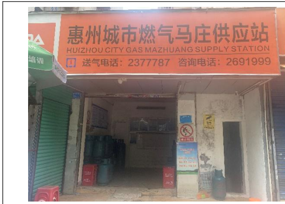
马庄瓶装气供应站外观