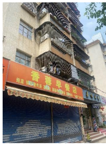
东面居民楼及早餐店