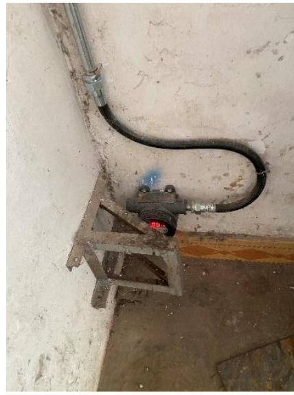
可燃气体检测探头