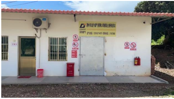
横沥土桥瓶装气供应站外观