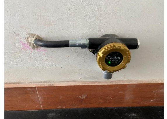
可燃气体检测探头