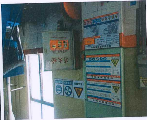
危化品安全周知牌