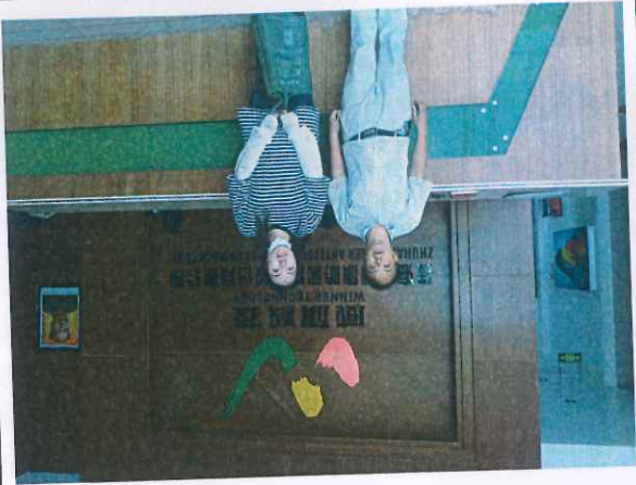
项目负责人现场照片