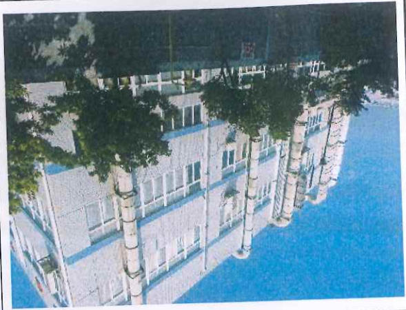
厂区东面永刚塑料公司