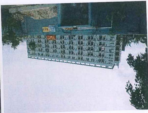
厂区北面珠海中电数码公司宿舍楼