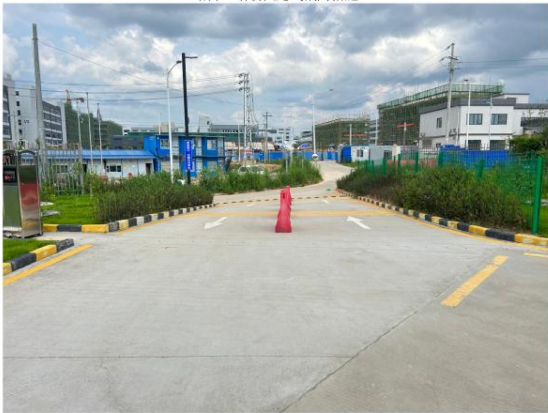
出入口已增设物理隔离措施