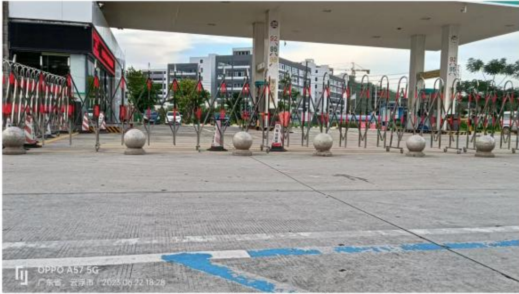
站内已增设固定式隔离措施