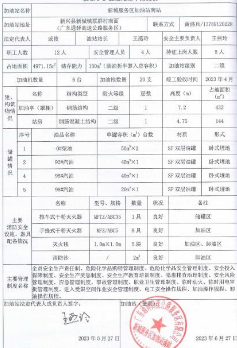
表 2.1-2 加油站基本情况表