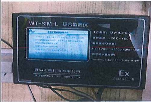
在线渗漏监测系统