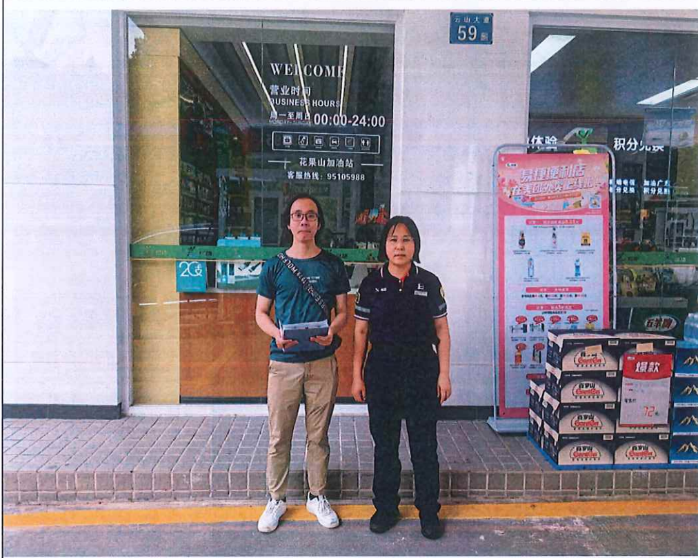
评价公司人员与油站人员合照