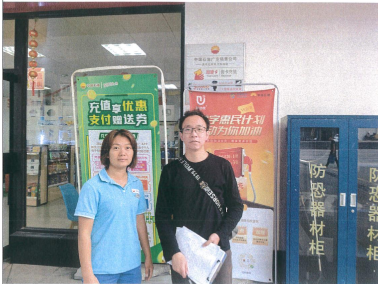
评价公司人员与油站人员合照