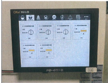
油罐、油管在线渗漏监测系统