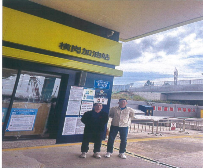
评价公司人员与油站人员合照