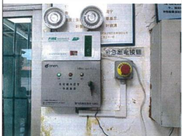
油罐—油管在线渗漏监测系统 站房内紧急按钮