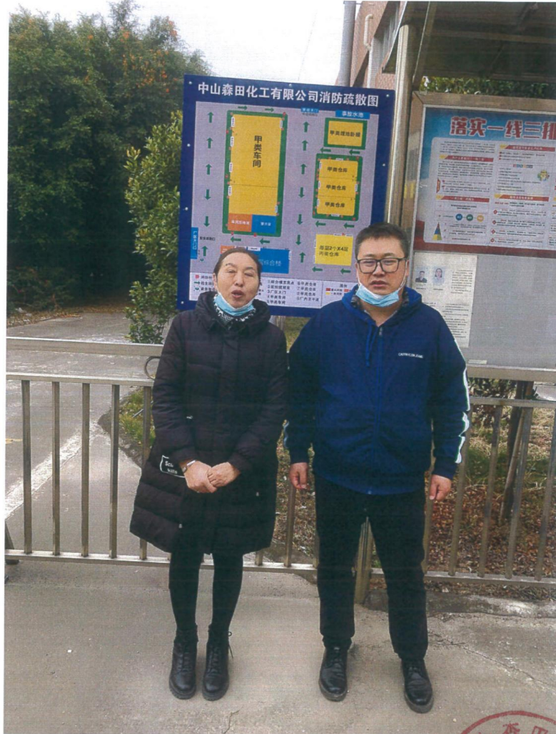
安全评价项目负责人现场勘查照片