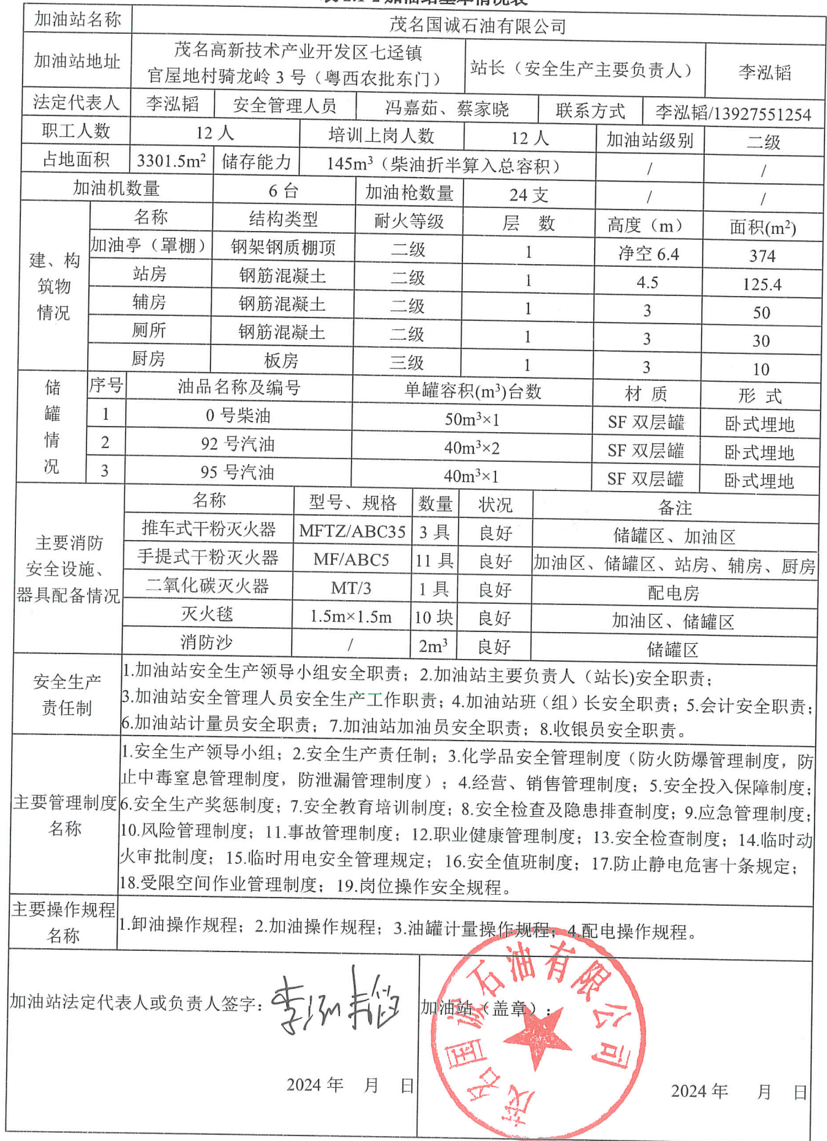
表 2.1-2 加油站基本情况表