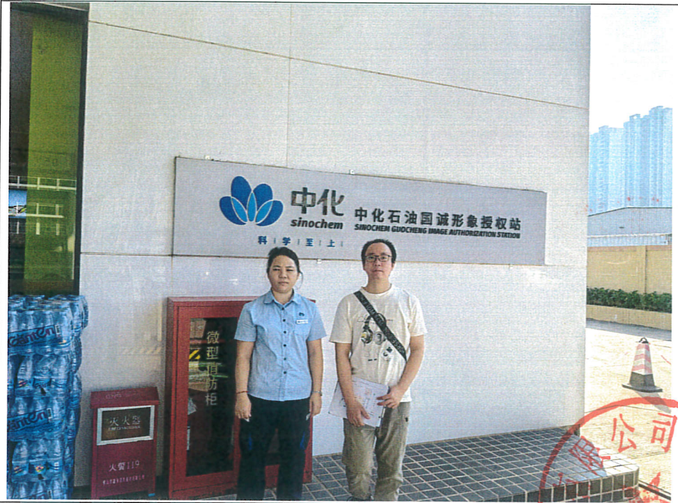
评价公司人员与油站人员合照