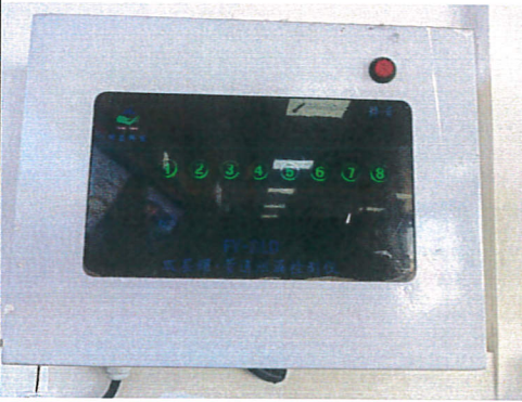
双层油罐双层油管在线渗漏监测系统