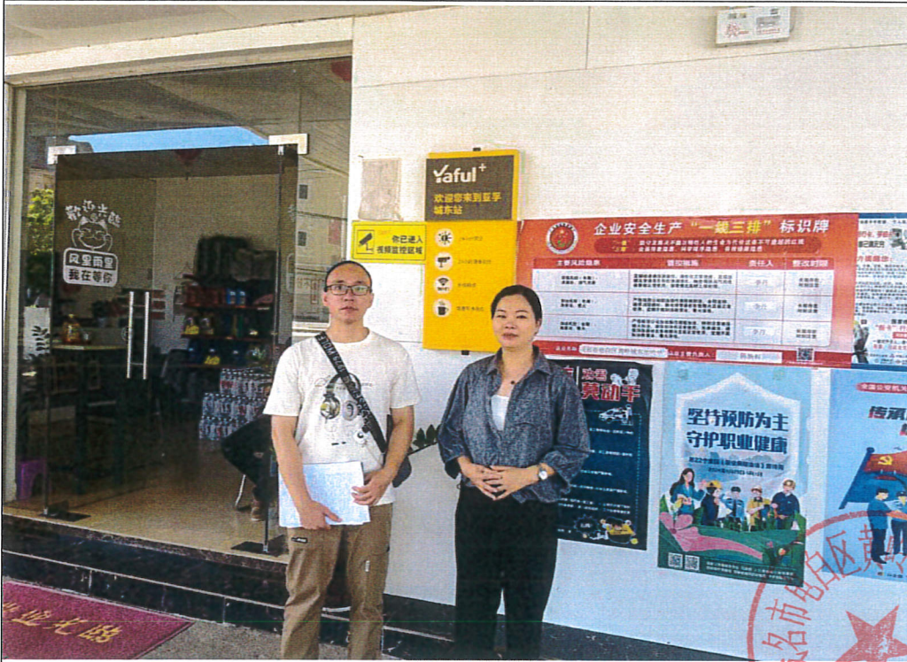
评价公司人员与油站人员合照